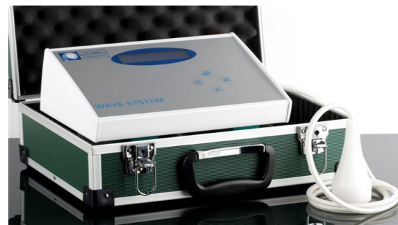
Wave System elektroporátor (Made in France – BFP Electronique)